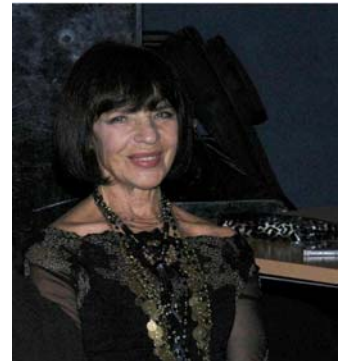
Gość specjalny: Sława Przybylska